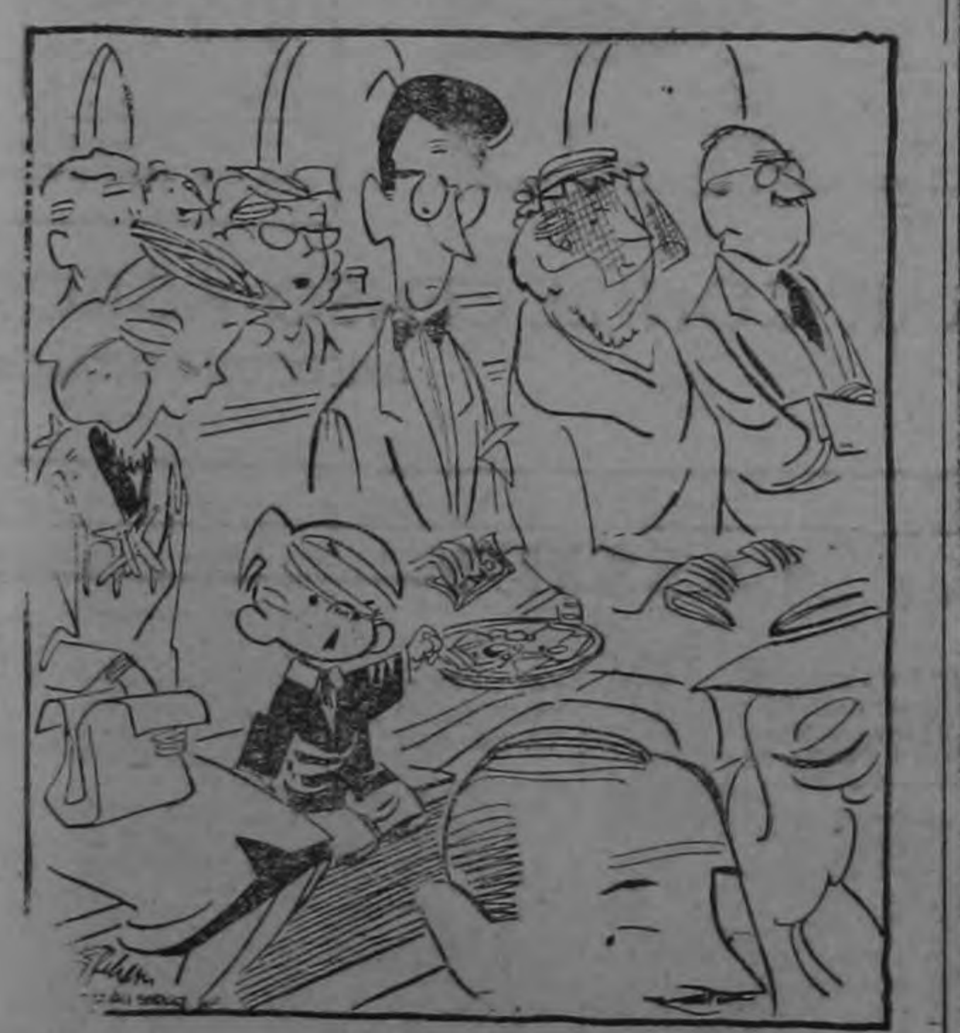
—Ojalá que con este dinero compren almohadillas para los bancos...